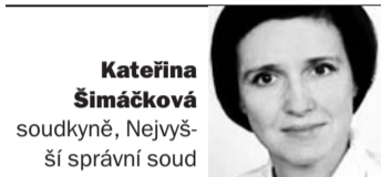
Kateřina Šimáčková soudkyně, Nejvyšší správní soud

V Mnichově na univerzitě se věnoval pedagogické a vědecké činnosti. Po listopadu 1989 se vrátil do Československa, byl jmenován univerzitním profesorem a v roce 1993 soudcem Ústavního soudu. Také publikoval knihy Politické reprezentace a volby v demokratických systé-